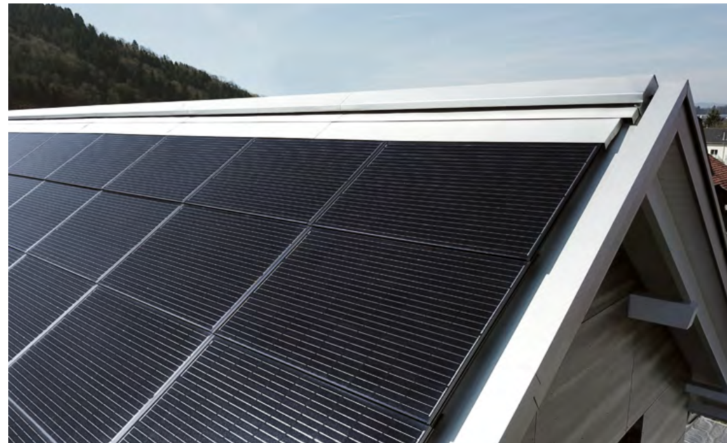
Des solutions détaillées et élégantes sont disponibles pour l'abergement supérieur et latéral. Les tôles standard garantissent une finition parfaite et une étanchéité remarquable.