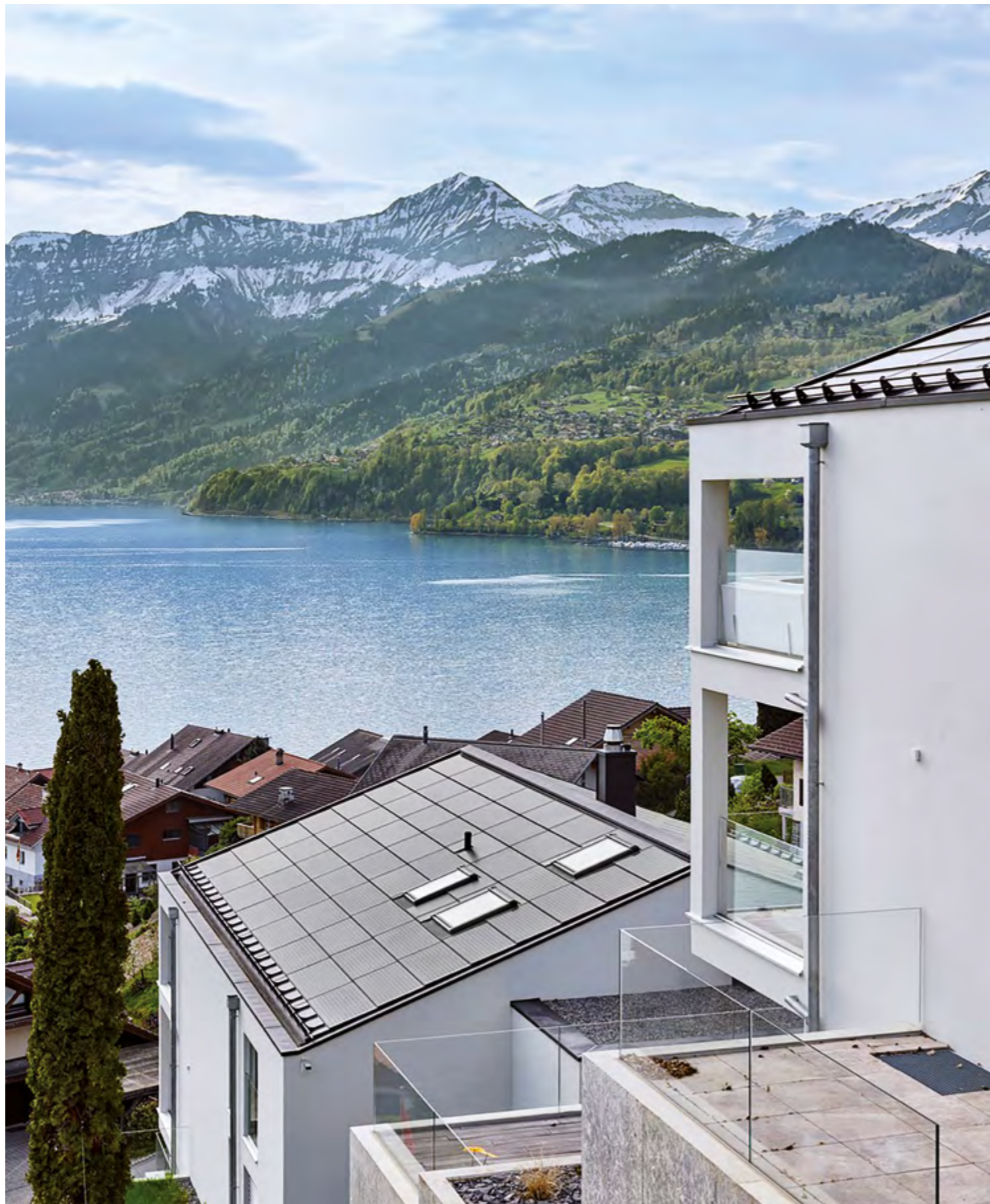
Deux logements collectifs situés au bord du lac de Thoune et équipés d'installations solaires Arres et de fenêtres hors système